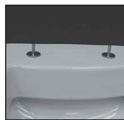
04 Fissaggi inseriti. Inserted fixing screws.