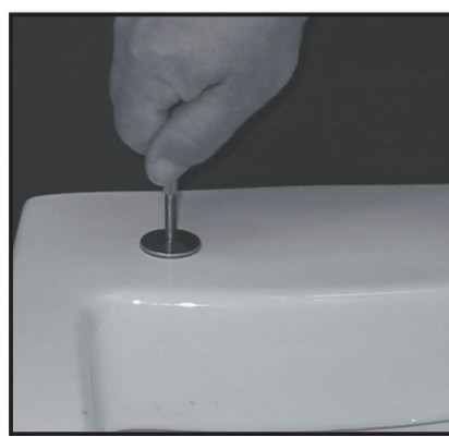
03 Avvitare il fissaggio tenendolo sollevato ma non bloccare. Tighten the fixing screw by keeping it lifted do not block.