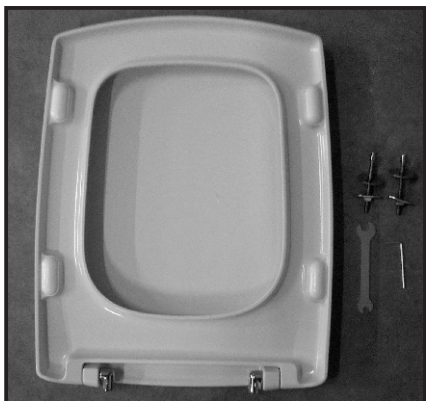
01 Composizione. Composition.