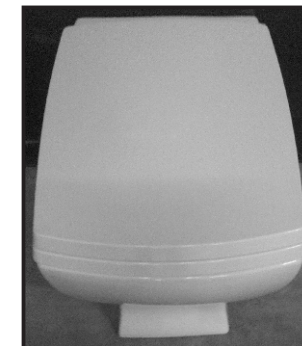
10 Copriwater installato. Installed seat cover.