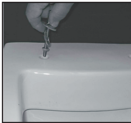
02 Inserire fissaggio nel foro del WC. Fixing screw insertion in the wc's opening.