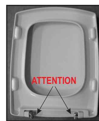
L Sinistra R Destra 05 Inserire le cerniere negli appositi fori. Insert the hinges in the appropriate openings.