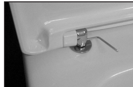
09 Stringere con la chiave in dotazione (brucola) la cerniera sul pin di fissaggio. Tighten the hinge on the screw's pin by using the provided key.