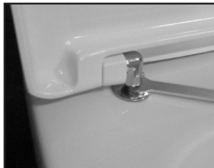
08 Stringere con la chiave in dotazione il fissaggio. Tighten the fixing screw by using the provided key.