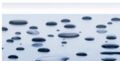
стекло с защитным покрытием